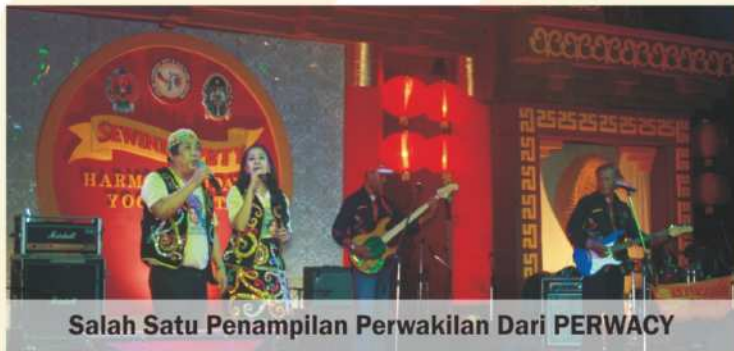
Salah Satu Penampilan Perwakilan Dari PERWACY