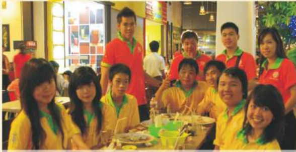
Acara Makan Malam Di Food Festival Surabaya