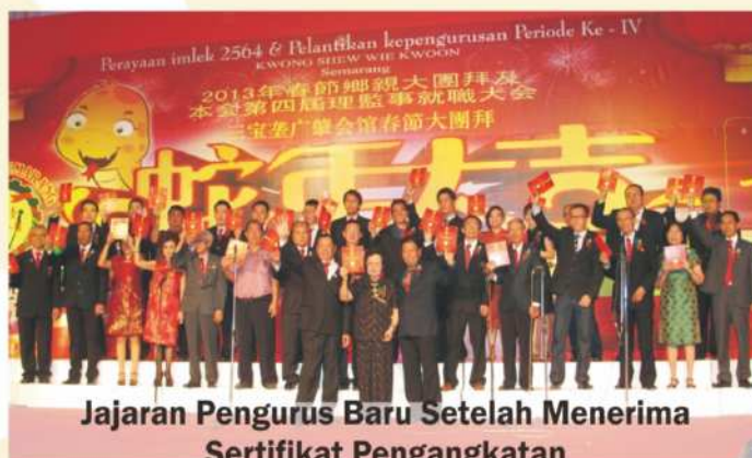
Jajaran Pengurus Baru Setelah Menerima Sertifikat Pengangkatan