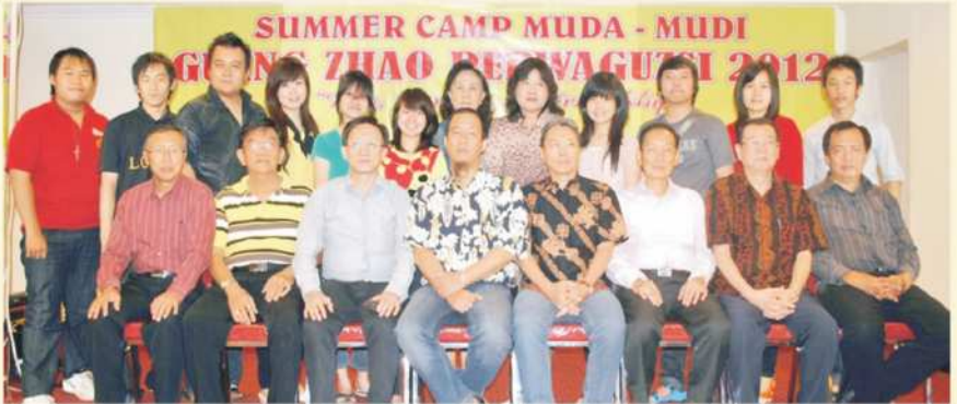
Delegasi Muda Mudi PERWACY Berfoto Bersama Pengurus KSHK