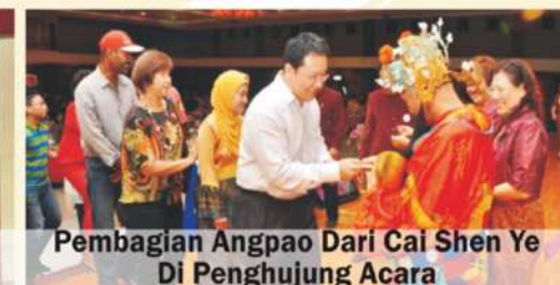
Pembagian Angpao Dari Cai Shen Ye Di Penghujung Acara