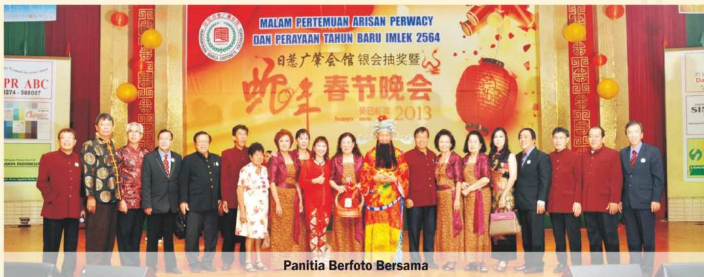
Panitia Berfoto Bersama