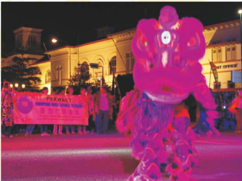
Perwakilan PERWACY Saat Mengikuti Pawai