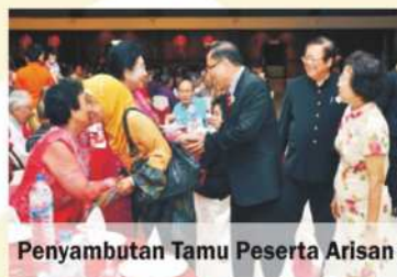
Penyambutan Tamu Peserta Arisan