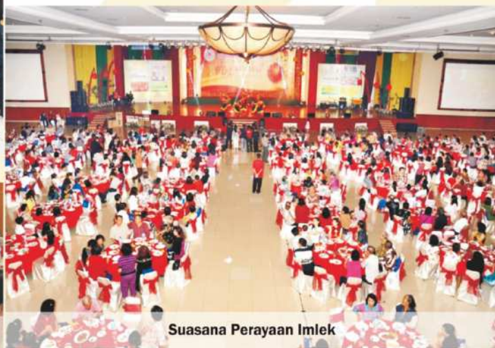
Suasana Perayaan Imlek