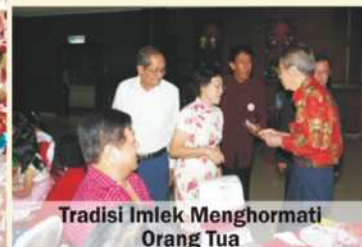
Tradisi Imlek Menghormati Orang Tua