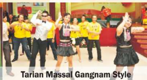
Tarian Massal Gangnam Style