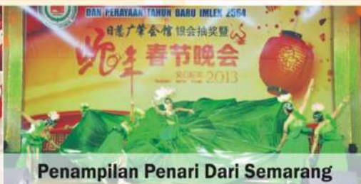
Penampilan Penari Dari Semarang