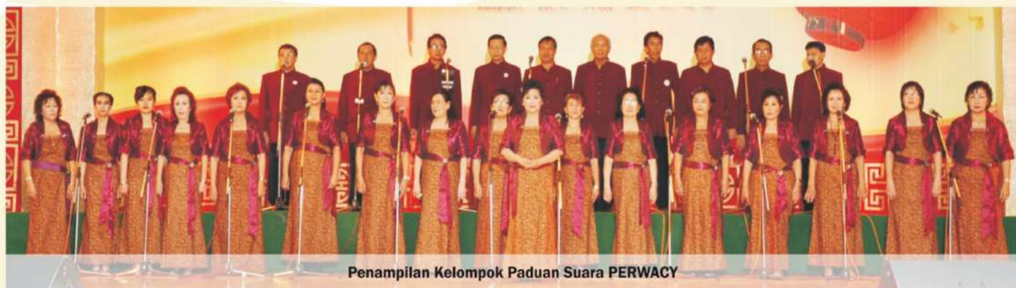
Penampilan Kelompok Paduan Suara PERWACY