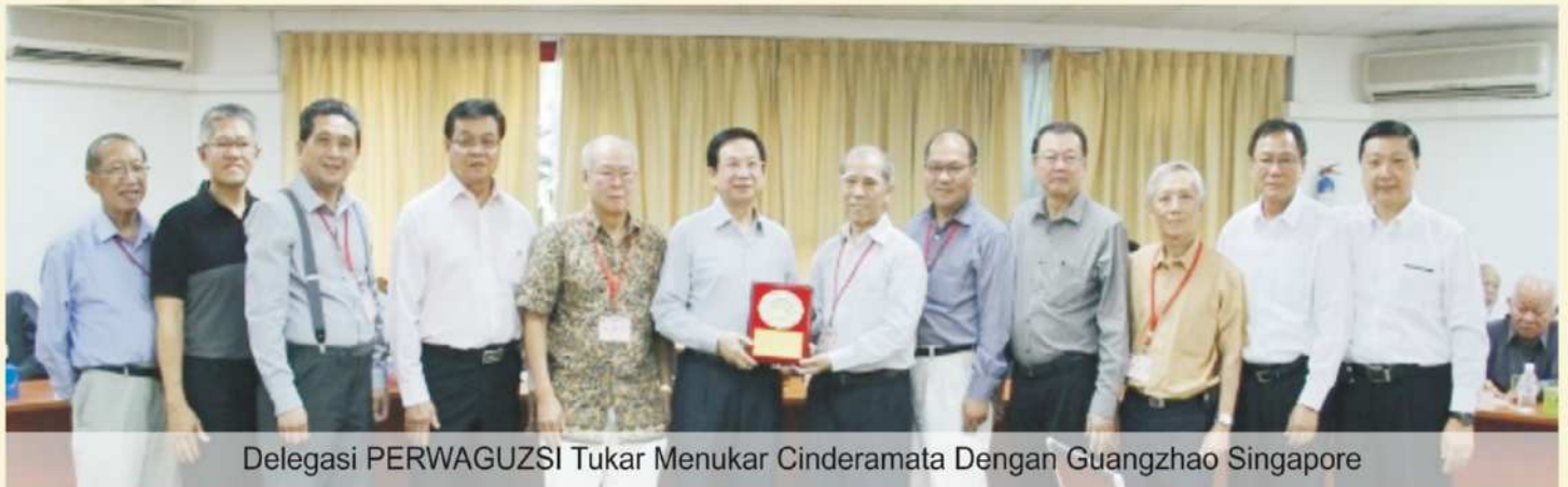
Delegasi PERWAGUZI Tukar Menukar Cenderamata Dengan Guangzhao Singapore