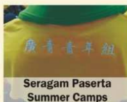
Seragam Peserta Summer Camps