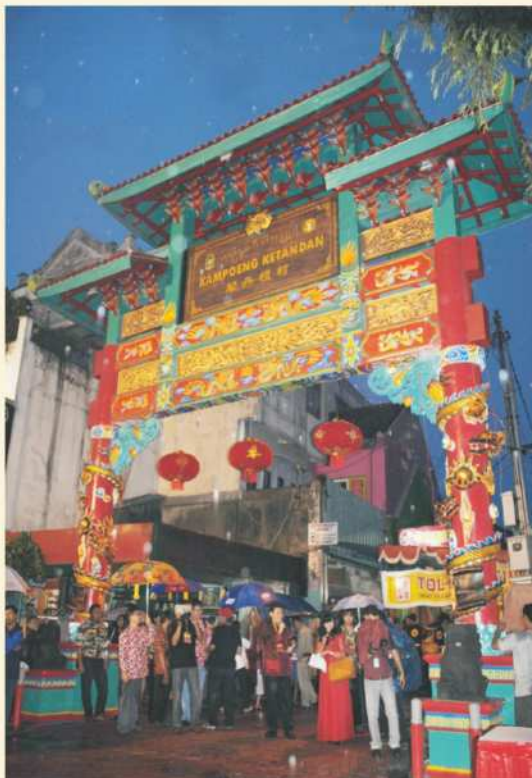
Peresmian Gapura Kampoeng Ketandan