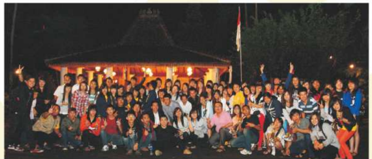
Malam Pergantian Tahun Baru 2013 Di Kaliandra