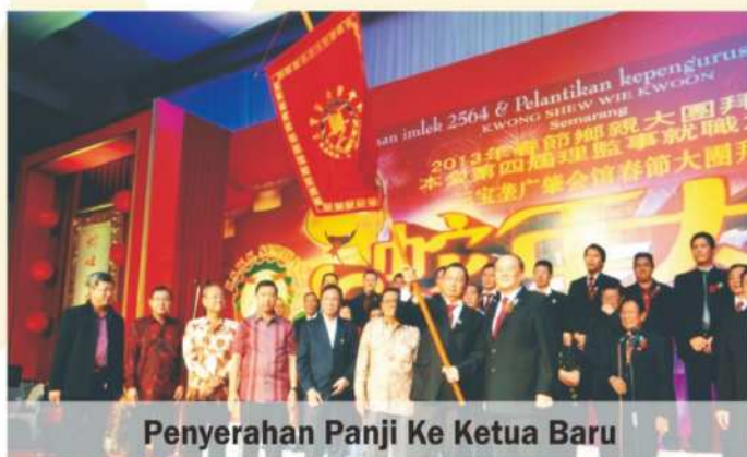
Penyerahan Panji Ke Ketua Baru

Frananto mengatakan dengan jarak yang tidak jauh maka kerjasama antar Jogja dan Semarang bisa berlangsung dengan intens. Dalam pertemuan ini kita bisa juga menjajagi kerjasama. Bila sering bertemu dan berkumpul, kita menjadi lebih dekat dan saling percaya akan tumbuh dengan sendirinya. ( team perwacy )