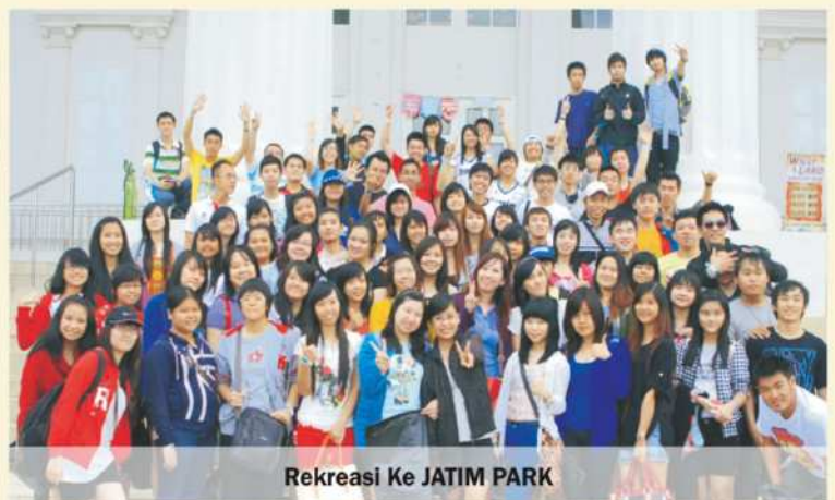
Rekreasi Ke JATIM PARK