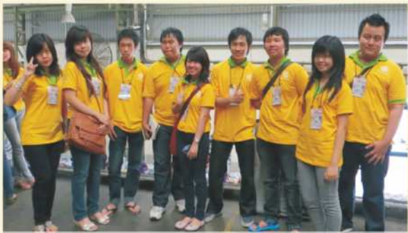
Kunjungan Ke Percetakan KOMPAS

Sehingga persatuan dan persaudaraan seluruh organisasi Guangzhao daerah terlaksana dengan baik dan lancar.