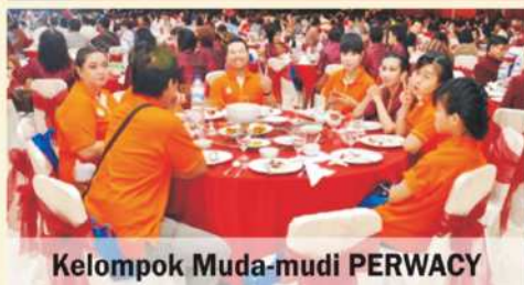
Kelompok Muda-mudi PERWACY