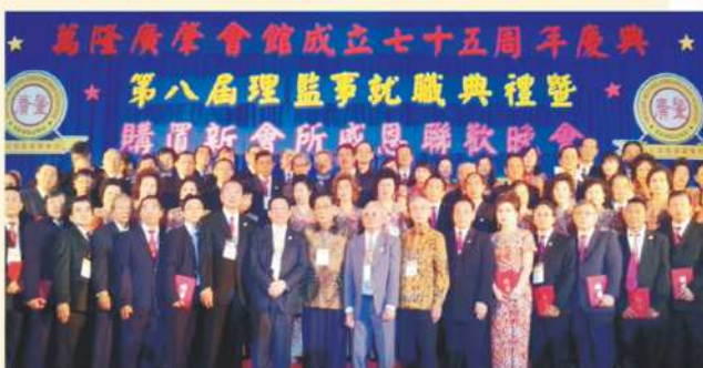
Jajaran Pengurus Baru Guangzhao Bandung