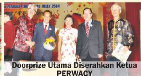
Doorprize Utama Diserahkan Ketua PERWACY