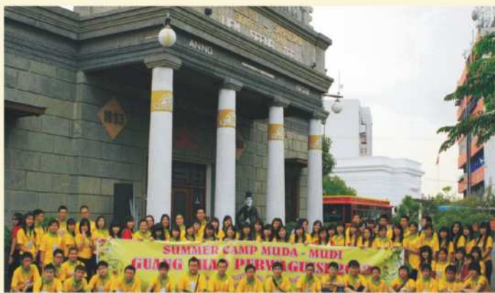
Peserta Summer Camps Berfoto Bersama Di Musium Sampoerna