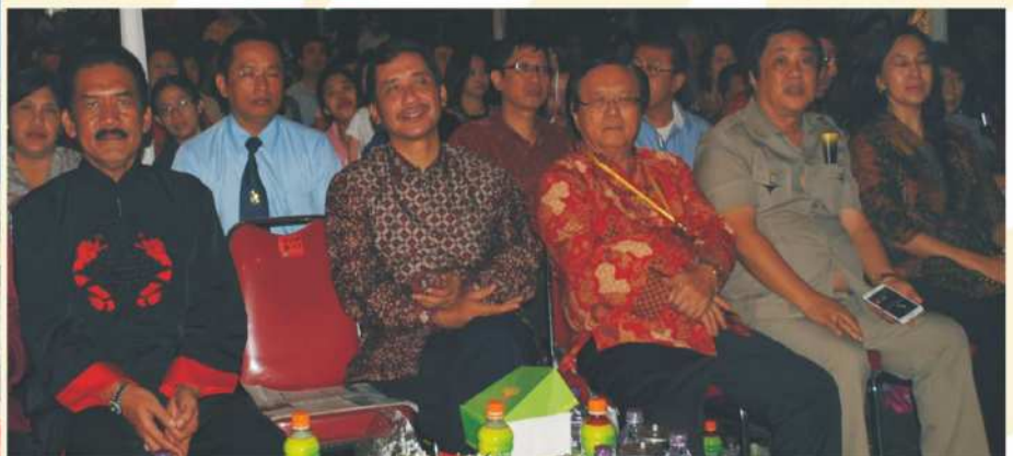
Wakil PERWACY Menghadiri Pembukaan PBTY