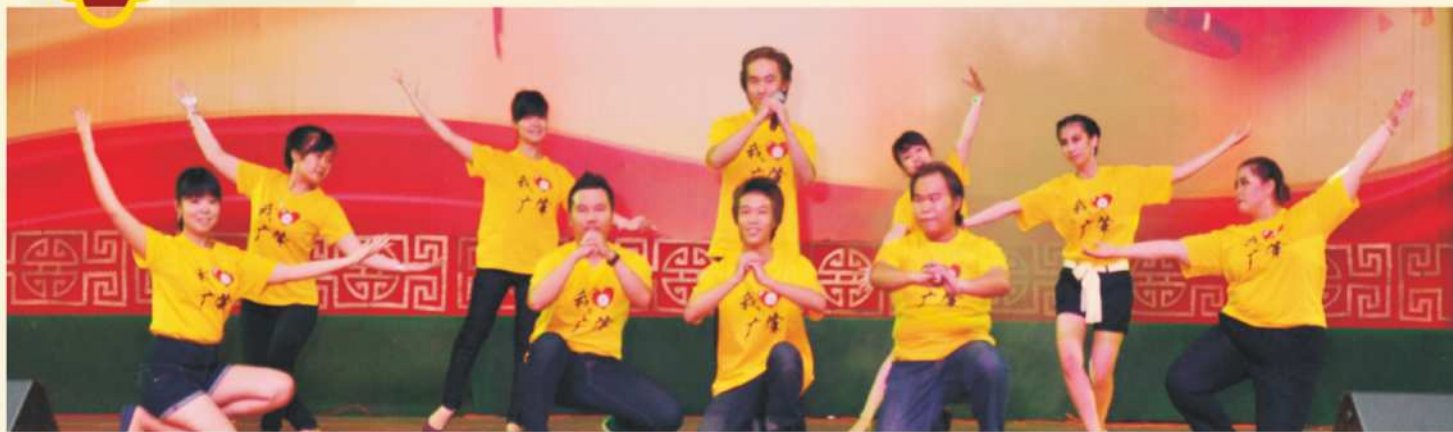
Penampilan Memukau Muda-mudi PERWACY