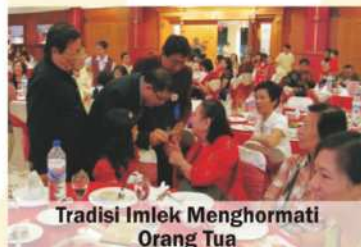
Tradisi Imlek Menghormati Orang Tua