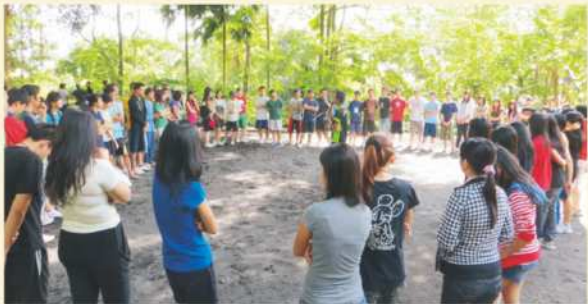
Suasana Breefing Outbond Di KALIANDRA Pasuruan