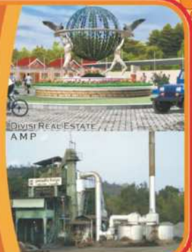
DIVISI REAL ESTATE AMP

E-mail : perwita_karya@yahoo.com , & perwitakarya@gmail.com