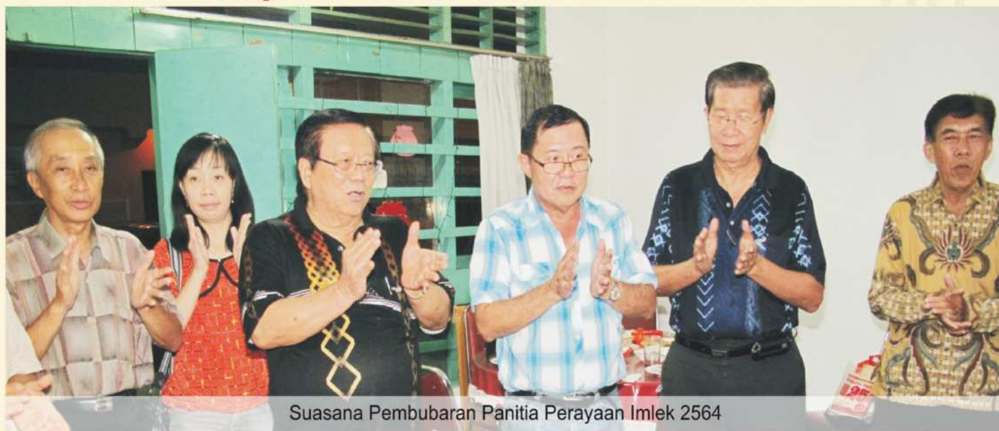
Suasana Pembubaran Panitia Perayaan Imlek 2564