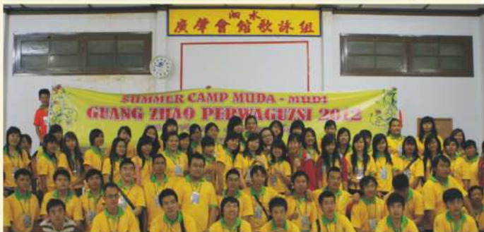
Foto Bersama Di Ruang Serbaguna KSHK

Acara puncak dilaksanakan di Kaliandra dengan penampilan tiap tiap kota menunjukkan aksi mereka sebelum hitung mundur pergantian tahun. Pergantian tahun dirayakan dengan mengelilingi api unggun dan ngobrol santai menjalin keakraban. ( team perwacy )