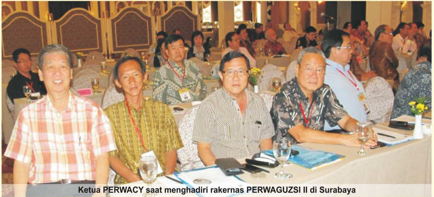
Ketua PERWACY saat menghadiri rakernas PERWAGUZSI II di Surabaya