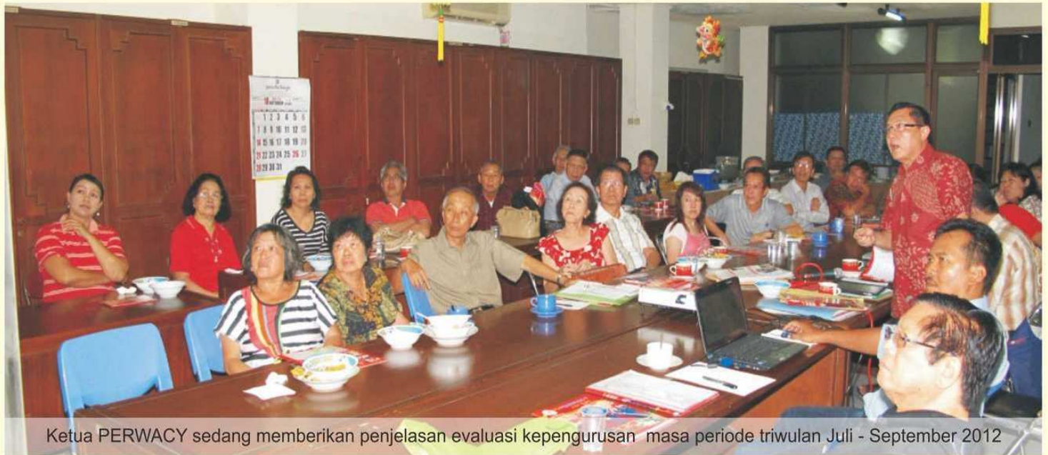
Ketua PERWACY sedang memberikan penjelasan evaluasi kepengurusan masa periode triwulan Juli - September 2012