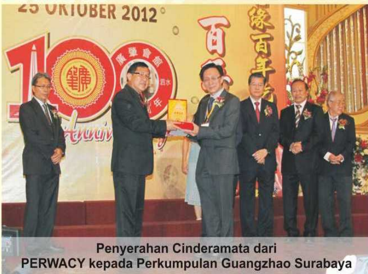
Penyerahan Cenderamata dari PERWACY kepada Perkumpulan Guangzhao Surabaya