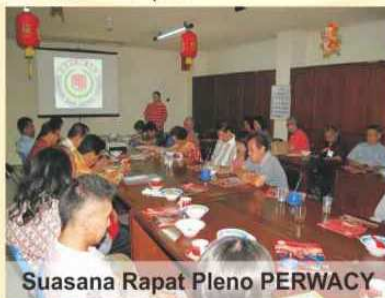
Suasana Rapat Pleno PERWACY