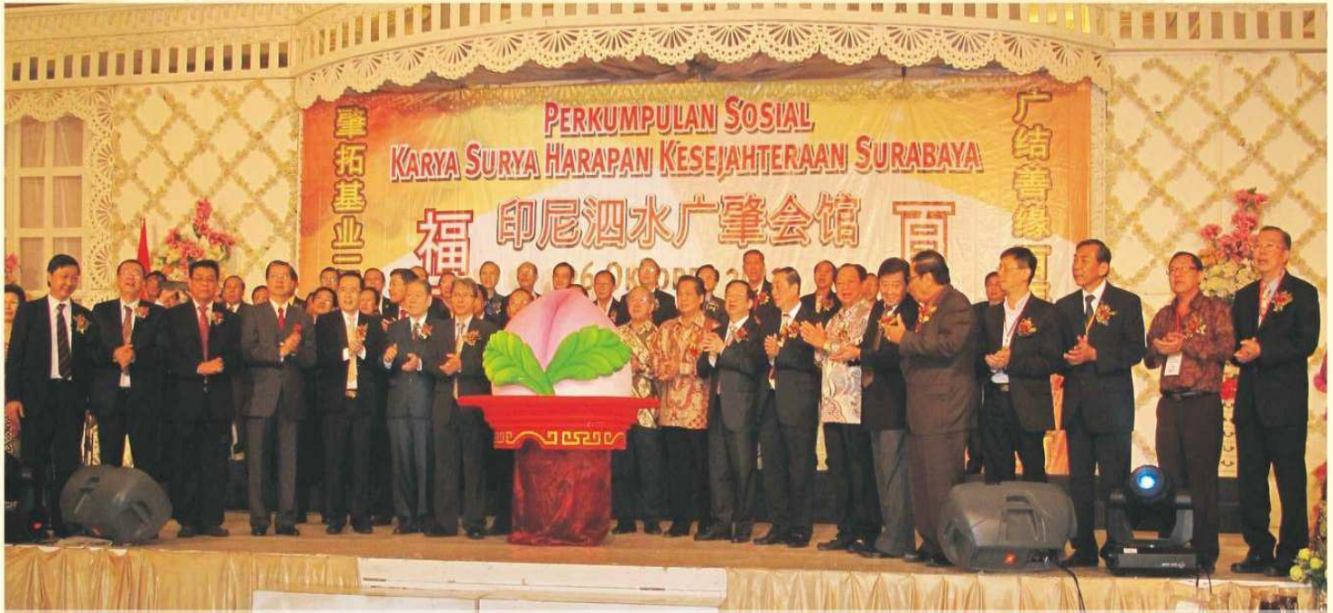
Seremonial ulang tahun ke 100 Perkumpulan Sosial KARYA SURYA HARAPAN KESEJAHTERAAN SURABAYA