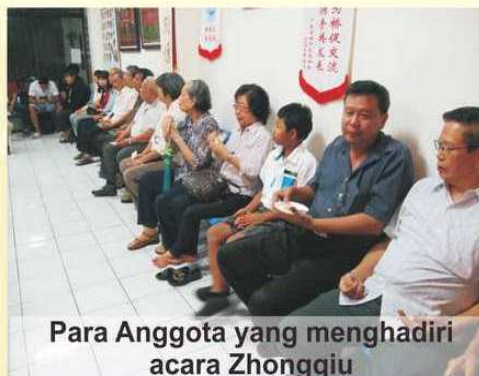
Para Anggota yang menghadiri acara Zhongqiu