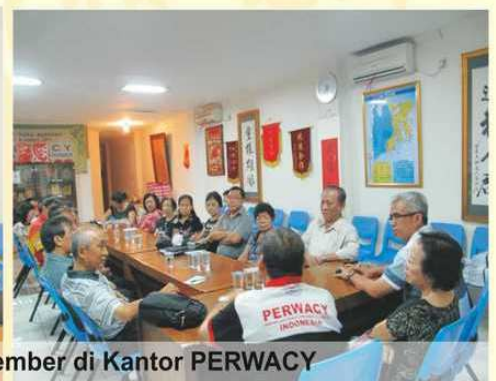
Suasana rapat rutin Pengurus pada tanggal 12 Oktober dan 9 November di Kantor PERWACY