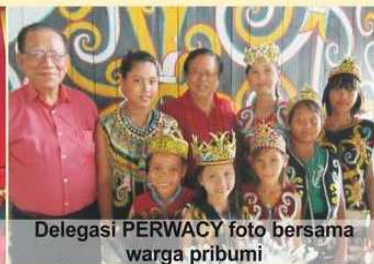
Delegasi PERWACY foto bersama warga pribumi