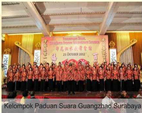
Kelompok Paduan Suara Guangzhao Surabaya