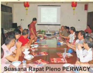
Suasana Rapat Pleno PERWACY

Menurut Frananto walaupun sebagai warga negara Indonesia, warga Guangzhao lahir tumbuh berkembang dan menutup mata pun di Indonesia. Pepatah mengatakan di mana kita berpijak di situ langit kita junjung tinggi.