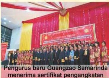
Pengurus baru Guangzao Samarinda menerima sertifikat pengangkatan

Dalam kesempatan kunjungan ke Samarinda itu, para tamu juga sempat menikmati kebudayaan Dayak dan juga keramahan warga Suku Dayak asli Kalimantan. "Kita merasakan kebersamaan, kerukunan serta persatuan dalam acara ini," papar Agung bersemangat. ( team perwacy )