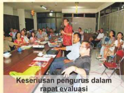
Keseriusan pengurus dalam rapat evaluasi