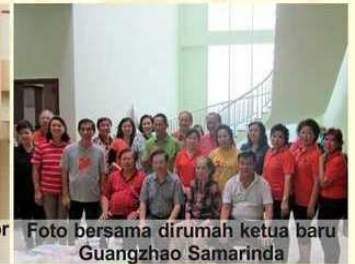
Foto bersama di rumah ketua baru Guangzhao Samarinda