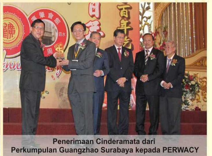
Penerimaan Cenderamata dari Perkumpulan Guangzhao Surabaya kepada PERWACY

Kemeriahan acara wellcome party ulang tahun Perkumpulan Sosial Karya Surya Harapan Kesejahteraan Surabaya diawali dengan saling tukar menukar cenderamata dari Perwakilan Guangzhao Daerah yang hadir kepada jajaran pengurus perkumpulan Guangzhao Surabaya, dilanjutkan dengan penyerahan cenderamata dari PERWAGUZI kepada para ketua Guangzhao Daerah yang hadir, kemudian acara dilanjutkan dengan penampilan