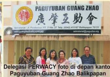
Delegasi PERWACY foto di depan kantor Paguyuban Guang Zhao Balikpapan