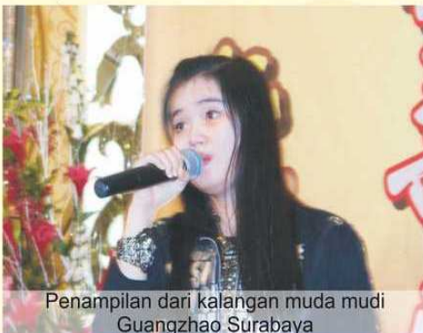
Penampilan dari kalangan muda mudi Guangzhao Surabaya

Acara diakhiri dengan foto bersama utusan Delegasi Guangzhao Daerah yang hadir pada acara tersebut dengan jajaran pengurus Guangzhao Surabaya. (team perwacy)