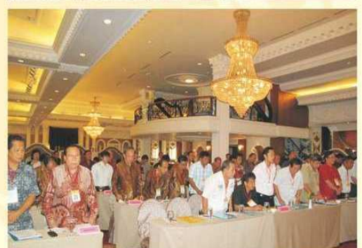
Para peserta Rakernas II PERWAGUZSI