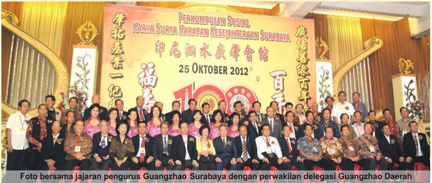
Foto bersama jajaran pengurus Guangzhao Surabaya dengan perwakilan delegasi Guangzhao Daerah