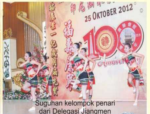
Suguhan kelompok penari dari Delegasi Jiangmen