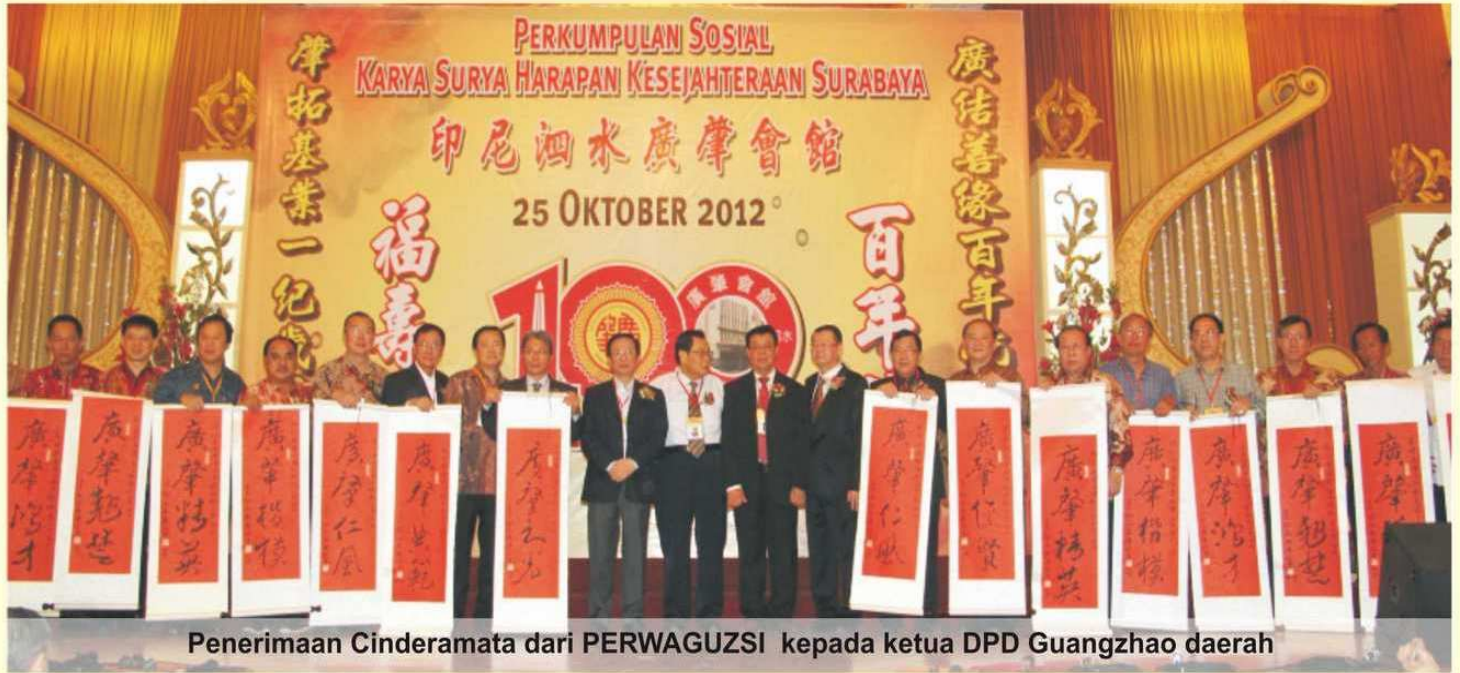
Penerimaan Cenderamata dari PERWAGUZI kepada ketua DPD Guangzhao daerah