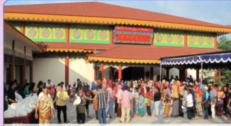
Suasana penerimaan paket sembako oleh warga