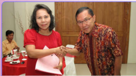
Acara penyerahan di Hotel Dalem Agung 99