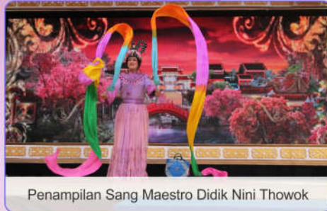
Penampilan Sang Maestro Didik Nini Thowok