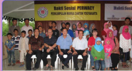
Foto bersama anak Panti Asuhan