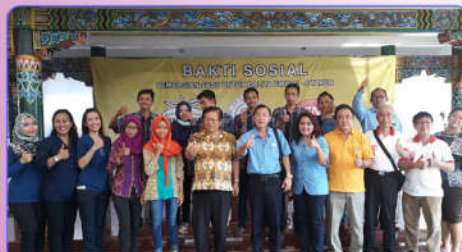
Foto bersama penyelenggara bakti sosial