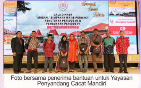
Foto bersama penerima bantuan untuk Yayasan Penyandang Cacat Mandiri

yang spektakuler hingga akhir. AC Central yang berfungsi sangat baik membuat gedung terasa "adem" meski dipenuhi tamu undangan yang menikmati hiburan, makanan dan suasana panggung yang dilengkapi dengan big screen LED videotron dan tata lampu beserta sound system yang sangat memukau.