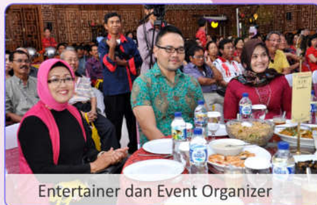
Entertainer dan Event Organizer