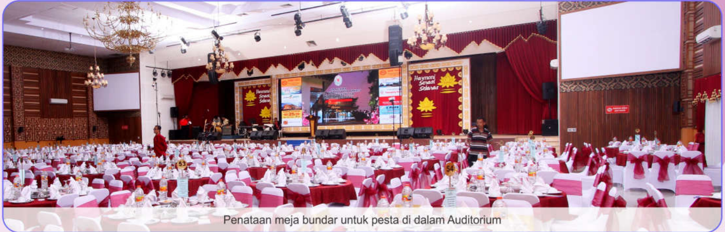
Penataan meja bundar untuk pesta di dalam Auditorium

Setelah sah sebagai Badan Hukum Perkumpulan, PERWACY kemudian berhasil menyelesaikan pembangunan gedung pertemuan megah dan membanggakan AUDITORIUM PERWACY, serta memulai mengembangkan usahanya di lahan luas "Taman PERWACY", Manggisian, Banguntapan, Bantul.