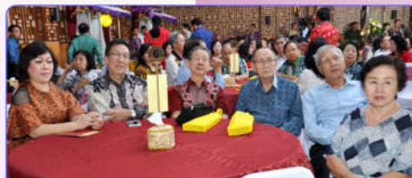
Para Tokoh Paguyuban Tionghoa