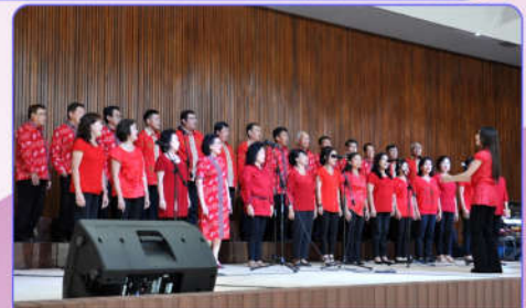
Penampilan Koor PERWACY

Prof Ir Prasasto Satwiko MBuild Sc Phd IAI secara cermat merancang bangunan ini sehingga memenuhi kriteria arsitektural sebagai bangunan dengan desain standart akustik yang dilengkapi bahan interior dinding dan plafond bersifat absorptif sehingga membuat ruangan nyaman tanpa terganggu kebisingan sound system, gema suara dan dengungan sound (feedback). (*)