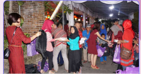
Pembagian paket Tas dan alat tulis untuk warga Desa Baturetno dan Desa Potorono