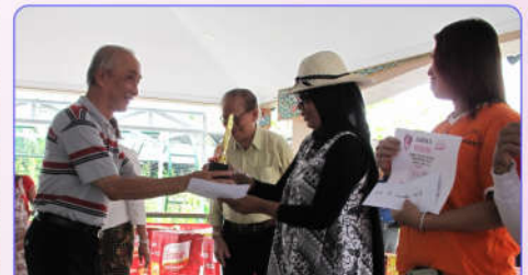
Penyerahan Hadiah Juara Lomba Memasak

Selanjutnya setelah pembangunan Taman Perwacy selesai total dengan keberadaan Auditorium Perwacy dan Joglo Perwita maka untuk menyemarakkan dan mengakrabkan dengan warga setempat digelar Lomba Memasak Ikan pada 15 Mei 2016. Lomba ini mendapat sambutan antusias warga yang