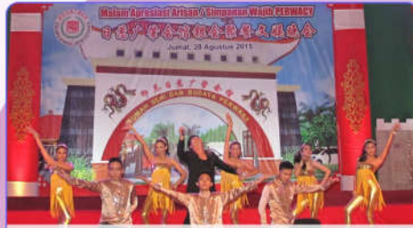
Lagu-lagu Mandarin dengan penari latarnya