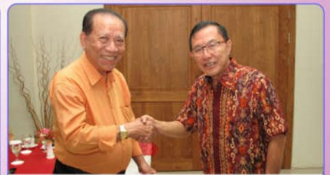
Pelaksanaan penyerahan tanggal 15 Mei 2015