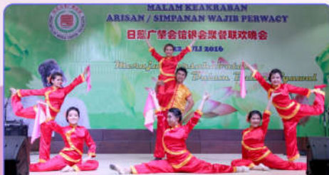
Penari dari Generasi Muda Perwacy performance