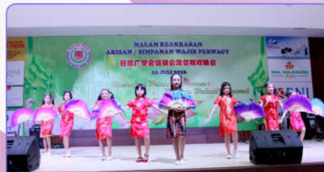
Penampilan adik-adik generasi penerus PERWACY