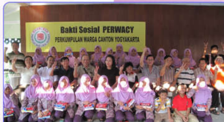
Keceriaan tampak saat foto bersama