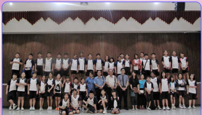
Foto bersama Pengurus Perwacy dengan Guru dan Siswa Singapore Piaget Academy Solo di dalam Auditorium Perwacy