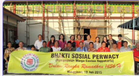
Foto bersama anggota dan Pengurus Perwacy dengan pejabat pemerintah setempat