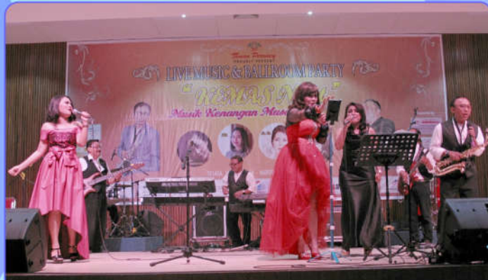
Penampilan artis pengisi acara Kemas Night

Auditorium Perwacy sebagai gedung pertemuan juga sangat representatif untuk konser pertunjukan musik. Hal ini terlihat dalam gelaran Live Music Kemas Night (Kenangan Masa) pada 10 Juli 2016. Even ini sekaligus membuktikan standar akustik yang dimiliki Auditorium Perwacy sangat teruji. Musik yang ditampilkan di dalam ruangan bisa terdengar berkualitas.