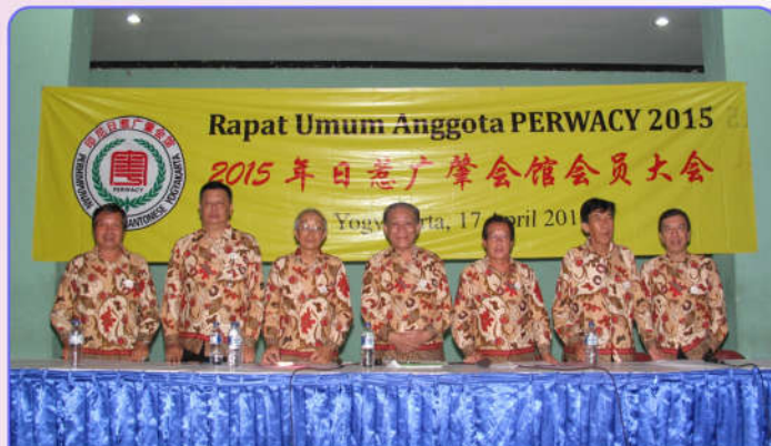
Tim 7 sebagai Steering Committee dalam Rapat Umum Anggota 2015

2015, tanggal 20 Mei 2015, PERWACY dinyatakan sah sebagai satu Badan Hukum Perkumpulan, yang dalam hukum diperlakukan sebagai orang yang memiliki hak dan kewajiban, mendapatkan perlindungan hukum atas harta kekayaannya serta pengembangan usaha bisnisnya. (*)