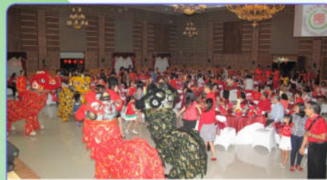
Barongsai ikut memeriahkan Imlek 2567