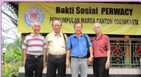
Menyelenggarakan Baksos Lomba Memasak