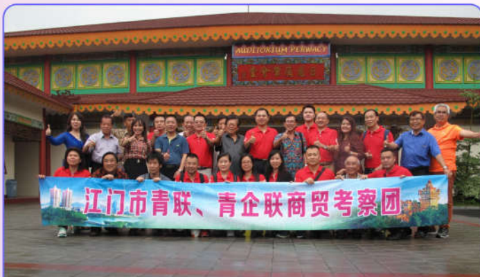
Foto bersama Pengurus Perwacy dengan Delegasi Pemuda dan Pengusaha Muda Jiangmen di depan Auditorium Perwacy

Pada bulan September 2016 PERWACY kedatangan Tamu Delegasi Pemuda Dan Pengusaha Muda Jiangmen dari Guangdong, Tiongkok. Bulan Desember tahun yang sama, Taman Perwacy dikunjungi siswa-siswi Singapore Piaget Academy dari Solo untuk mengenal lebih dekat Budaya Tionghoa. (*)