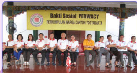
Jajaran Pengurus Perwacy di baksos Ramadhan 1438H