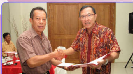
Bendahara Umum pengurus harian PERWACY