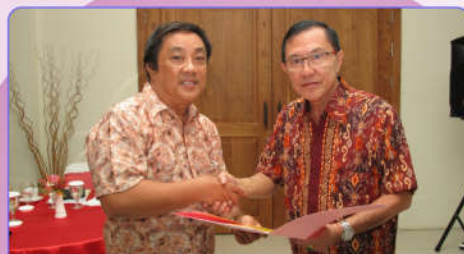
Surat Pengangkatan pengurus periode 2015-2018