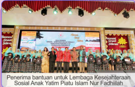
Penerima bantuan untuk Lembaga Kesejahteraan Sosial Anak Yatim Piatu Islam Nur Fadhiilah