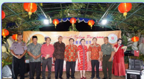
Para Pejabat Pemerintah beserta Jajaran Pengurus