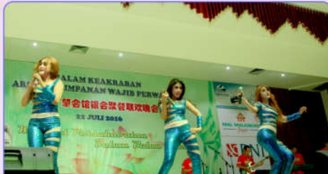
Penampilan heboh artis ndangdut kondang