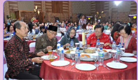
Pejabat Pemerintah dan Tokoh masyarakat