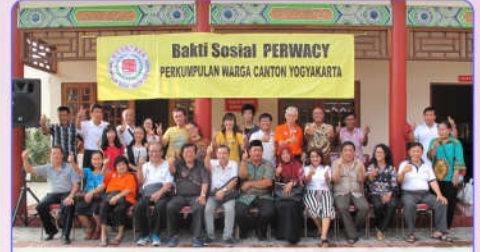
Semangat anggota dan pengurus sesuai baksos