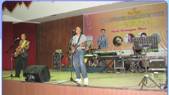
Koes Plus Mania tak ketinggalan tampil

Auditorium Perwacy sebagai gedung pertemuan juga sangat representatif untuk konser pertunjukan musik. Hal ini terlihat dalam gelaran Live Music Kemas Night (Kenangan Masa) pada 10 Juli 2016. Even ini sekaligus membuktikan standar akustik yang dimiliki Auditorium Perwacy sangat teruji. Musik yang ditampilkan di dalam ruangan bisa terdengar berkualitas.