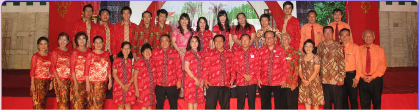
Jajaran Pengurus dan pendukung acara foto bersama setelah selesai acara

Gala Dinner Arisan/Simpanan Wajib Perwacy 28 Agustus 2015 di Grand Pacific ini menjadi yang terakhir PERWACY menyewa gedung pertemuan untuk berkegiatan. Saat itu gedung Auditorium Perwacy di Banguntapan sudah berdiri megah namun masih dalam tahap finishing. "Setelah Gedung Taman Perwacy beroperasi maksimal, justru PERWACY punya unit usaha persewaan gedung, dan segala kegiatan PERWACY bisa