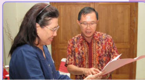
Penyerahan surat pengangkatan pengurus