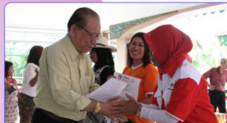
Lomba Memasak Ibu PKK di Joglo Perwita