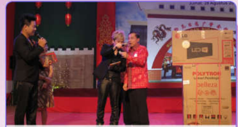
Pengundian Doorprize utama untuk peserta arisan