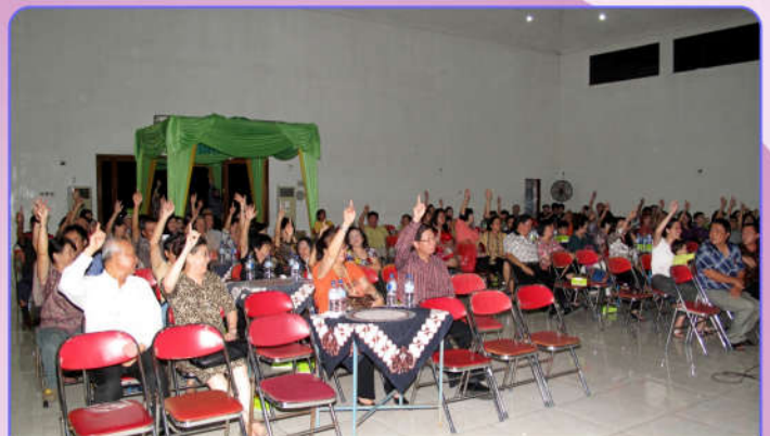
Suasana RUA di Gedung Pamungkas, 17 April 2015