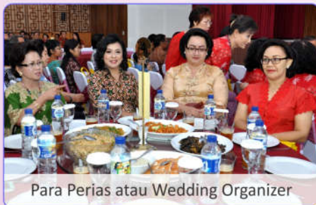
Para Perias atau Wedding Organizer