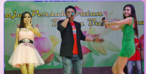
Artis Orkes Melayu New Padmaradja Yogyakarta