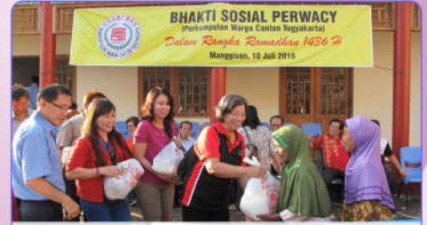
Sembako untuk warga sekitar Taman Perwacy

Sebagai upaya sosialisasi dan mendekatkan diri pada masyarakat sekitarnya dengan keberadaan Taman Perwacy yang pembangunannya sudah selesai 95 persen dan dalam proses finishing, Pengurus Perwacy menggelar bakti sosial 10 Juli 2015. Bakti sosial membagikan paket sembako pada 300-an warga sekitar Taman Perwacy di Manggisan, Baturetno, Banguntapan, Bantul. "Harapannya Taman Perwacy membawa manfaat untuk