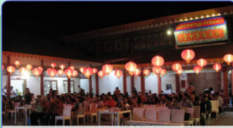
Atribut lampion wajib dipasang saat Zhongqiu