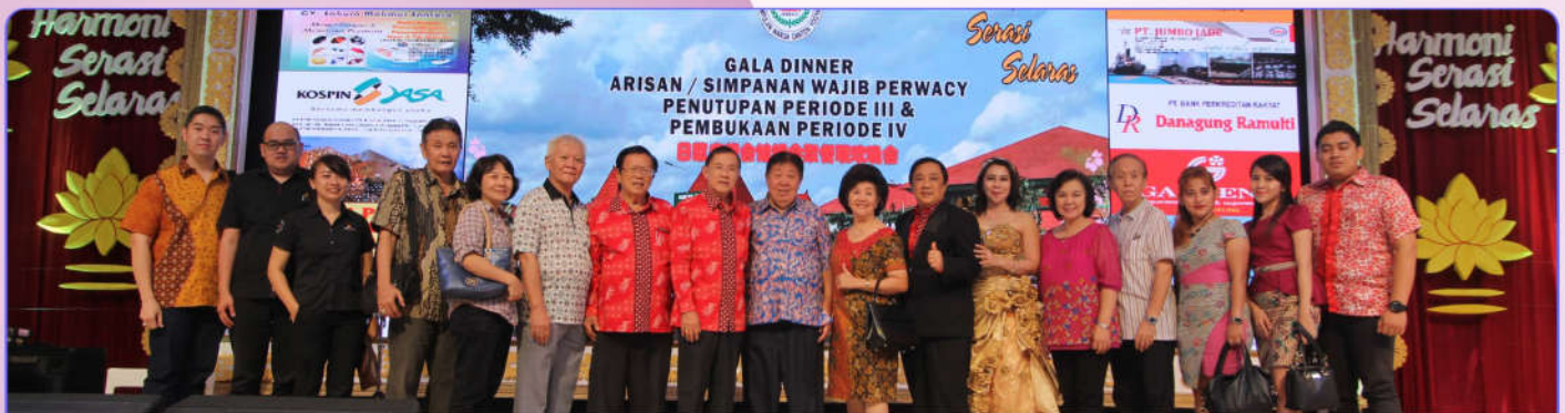
Ketua Umum, Ketua Kehormatan dan Ketua Perwacy foto bersama dengan peserta arisan dari luar kota Yogyakarta

Gala Dinner Arisan Perwacy Penutupan Periode III dan Pembukaan Periode IV berlangsung semarak dengan suasana persaudaraan, Kamis (18/5/2017) malam di Auditorium Perwacy, Taman Perwacy. Terlihat suasana persatuan dan kerukunan di tengah masyarakat multikultur di Yogyakarta.