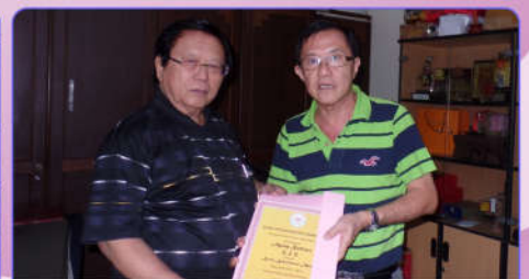
Acara penyerahan di Kantor Perwacy, 22 Mei 2015