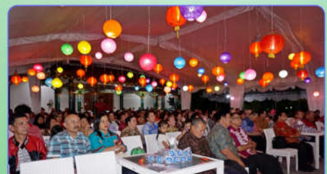
Hadirin memenuhi tenda berhias lampion warna-warni

Perayaan Zhongqiu 2017 ini berlangsung dalam suasana kekeluargaan dengan kehadiran Pengurus, Anggota Perwacy yang berbaaur dengan warga sekitar Taman Perwacy, juga jajaran pemerintah, muspika dan Lurah setempat dari Lurah Baturetno,