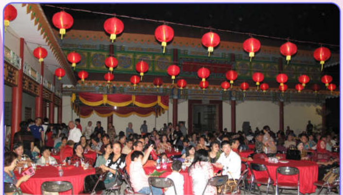
Dekorasi suasana perayaan Zhongqiu di halaman depan Auditorium